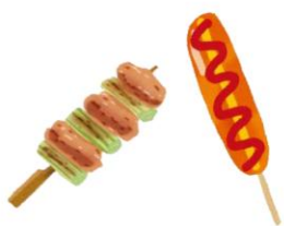
焼き鳥・フランクフルトなど 直前加熱のもの