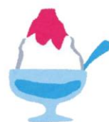
かき氷、わらびもち