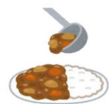
ご飯の取り扱い (直前加熱した食品を 組み合わせるのみ)

以下の例のように米飯を取り扱う場合や直前加熱した食品同士を組み合わせる場合は同時に取り扱えるメニューは 1品目のみ となります。（上記品目と同時に取り扱うことはできません。）