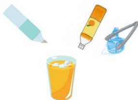
簡単な飲料の調製